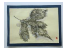
No.5 虫食いの葉を描く