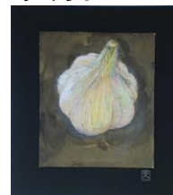
No.6 ネガポジにんこく