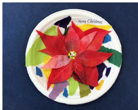
No.1 「ポインセチアのクリスマスプレート」