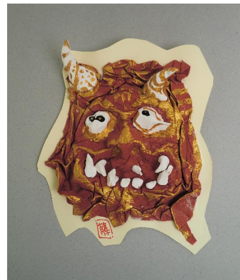
No.3 「鬼の顔のレリーフ」